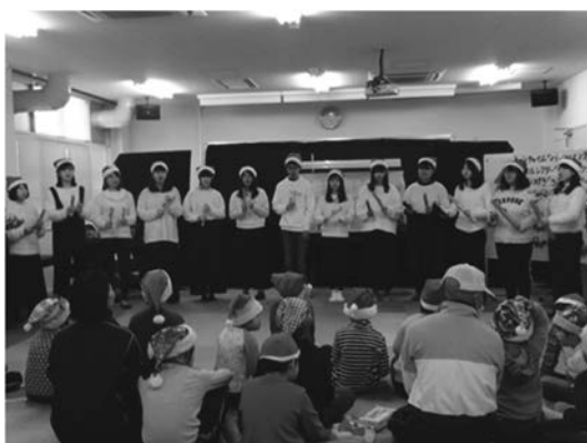
図10 特別支援学校の児童の前でトーンチャイム

毎年12月に、附属特別支援学校小学部の児童を対象に、幼児音楽ゼミの4回生と1回生全員が、人形劇とトーンチャイム演奏、季節の手遊びや歌遊びなどを行っている(図10)。「うたとおはなしの会」を見学した小学部の教諭の一人が、プログラム内容が幼児向けであり、音楽をたくさん使っていることから、言語や知的な面で理解が難しい児童でも十分に楽しめると考え、2005年から年に1回の交流が始まった 2) 。支援学校の児童は、音楽を身体全体で楽しんだり喜びを声や表情として表出したりするなどの反応を見せるが、そうした反応をうまく引き出すために、ここ数年は大学教員と支援学校小学部教員が事前に打ち合わせを行い、学生に演技上工夫してほしい点(児童の発声を促すこと、物語の一部に児童が参加する部分は特にわかりやすく指示を出すことなど)を確認している。このような打ち合わせを経て事前に指示を与えることで、演目の中での学生と児童とのコミュニケーションがよりスムーズに行われるようになった。