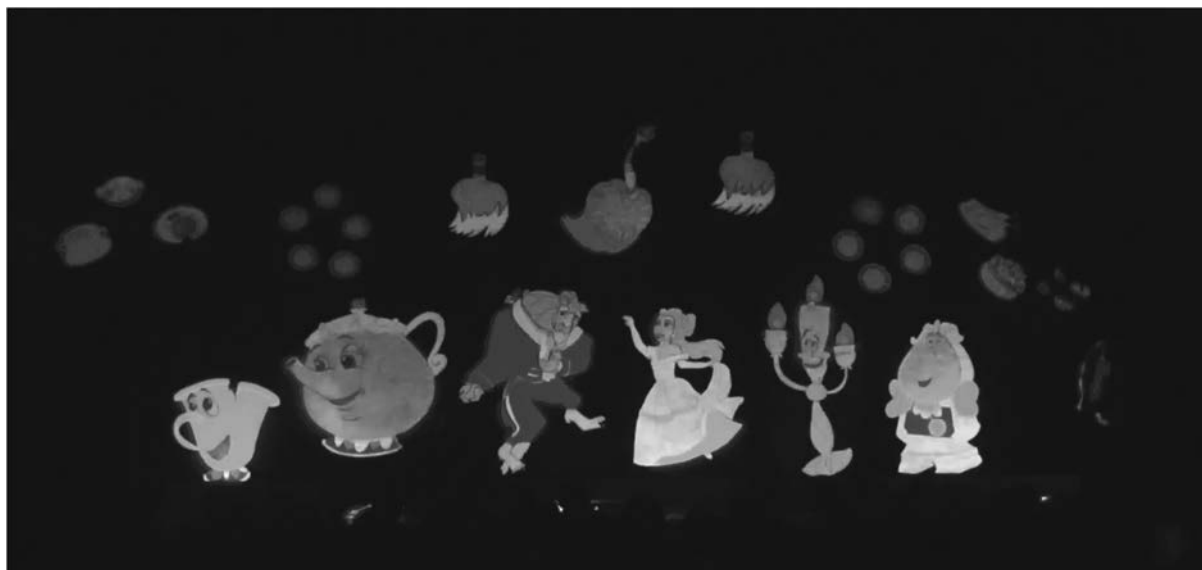
図9 「美女と野獣」の一場面

2018年度の「ブラックファンタジー 美女と野獣」では、専用の蛍光塗料で段ボールに描かれた主人公のベルと野獣や、登場人物、小道具などが、暗闇の中で音楽に合わせて現われたり消えたり、目まぐるしく動き回ったりする様子（図9）に、園児と保護者から歓声が上がった。保護者へのアンケートでは、「大人の私達でもワクワクするようなかげが次々に飛び出し、びっくりしました。学生さんの技量も素晴らしいと思いました」、「若いエネルギーあふれる華やかでパワフルなステージでした。メリハリがあり、子どもをあきさせない内容は、驚きの連続でした。後ろからは子どもたちの表情は見ることはできなかつたのですが、さぞかし興味津々に表情豊かに見ていたことと思います」のような感想が見られた。