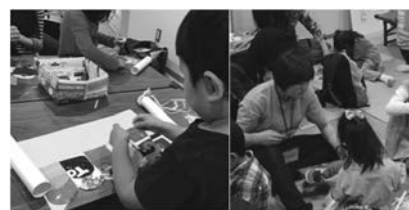
図5 こいのぼり作り

うたとおはなしの会は、幼児音楽教育ゼミの学生4～6名が中心となり、3回生の冬と4回生の春に行っている。3(4)回生は教員の指導を受けながら、プログラムの構成や内容、役割分担を考え、それぞれについて練習を重ねる。人形劇に使用する人形の制作はプロに発注するが、それ以外の大道具や小道具は学生が手作りする。また、1回生が、4月の入学直後から運営のサポートを行う。1回生が担当するのは、参加者に配るお土産作り、会場の準備、舞台の設営、当日の参加者の案内、受付、進行上の補助（大道具の出し入れ、子どもへの楽器の配布など）、エンディングの歌の発表、ワークショップ（造形コーナー）の準備・運営である。1回生への説明や指導は3(4)回生が行っている。