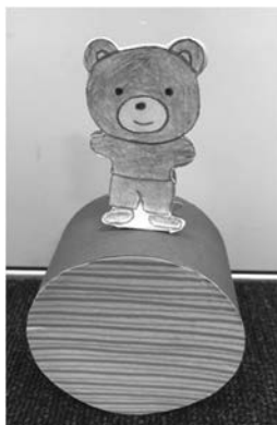
図7 手作りのお土産