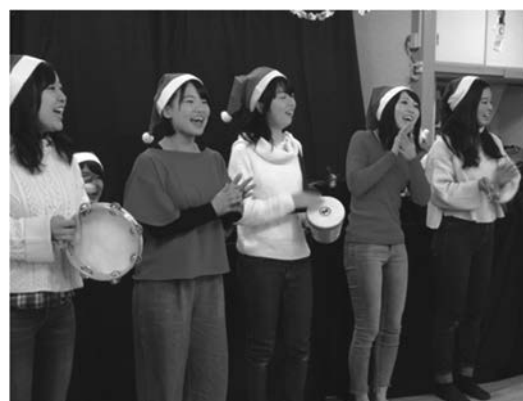
図11 墨染保育所の園児の前で歌う学生