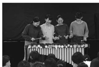
図4 音楽教育専攻学生による演奏