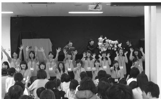
図2 うたとおはなしの会の一場面

回は会の終了後に、お菓子の空袋などの廃材を使ったこいのぼり作りのワークショップ（図5）も行った。