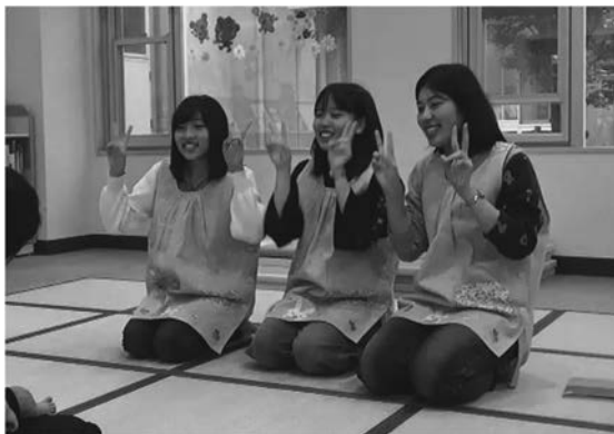
図6 えほんのもりの様子

担当する。担当する学生は、季節に応じた絵本（紙芝居）を選んで読み聞かせの練習をし、案内のポスター（図8）とお土産を考えて作る。導入や、絵本と絵本の間のつなぎに行うお話や手遊びも考えて練習する。会場の絵本コーナーの窓や壁に、季節にあった壁面構成を行うことも、担当者の役割である。